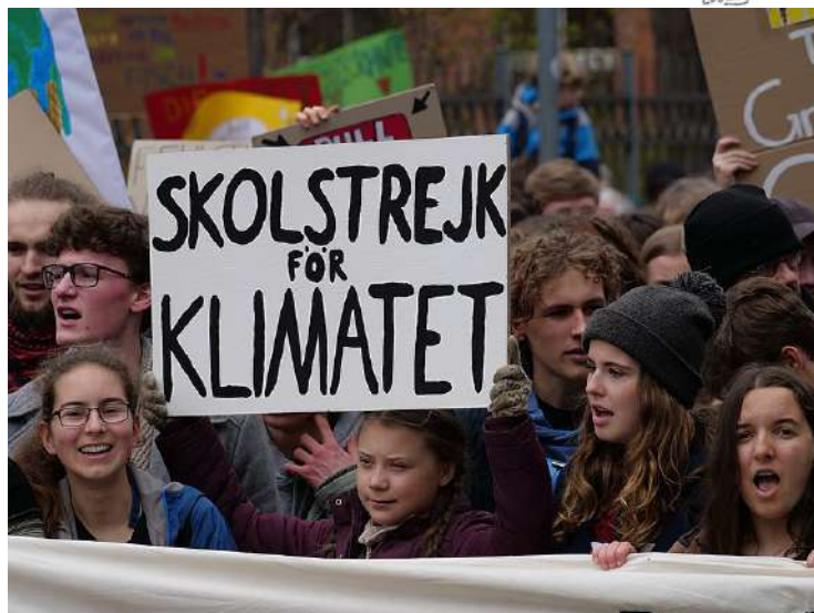
Greta Thunberg lors de la manifestation FridaysForFuture le 29 mars 2019 à Berlin.

Greta Thunberg, avec quinze autres enfants, a porté plainte contre la France, l'Allemagne, l'Argentine, le Brésil et la Turquie, le 23 septembre dernier. Elle accuse ces pays de trahison sur les questions du dérèglement climatique.